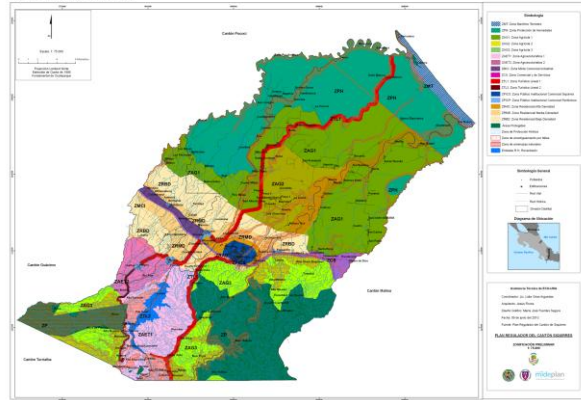
Cantón 703: Siquirres